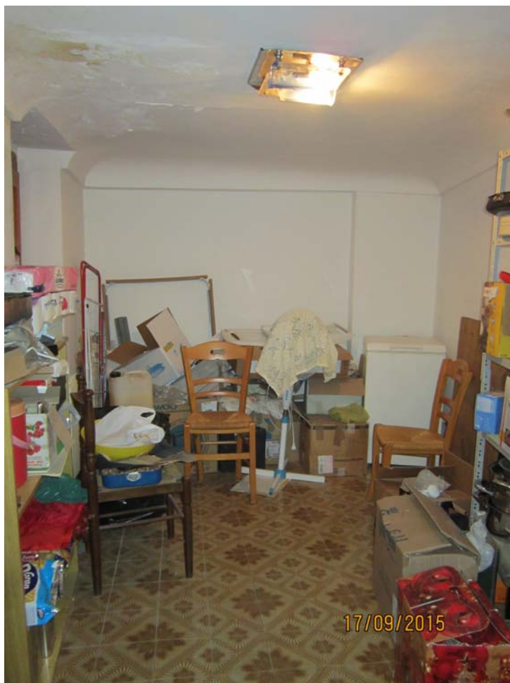
Foto n° 8 – Appartamento a Buccheri – Ripostiglio piano ammezzato