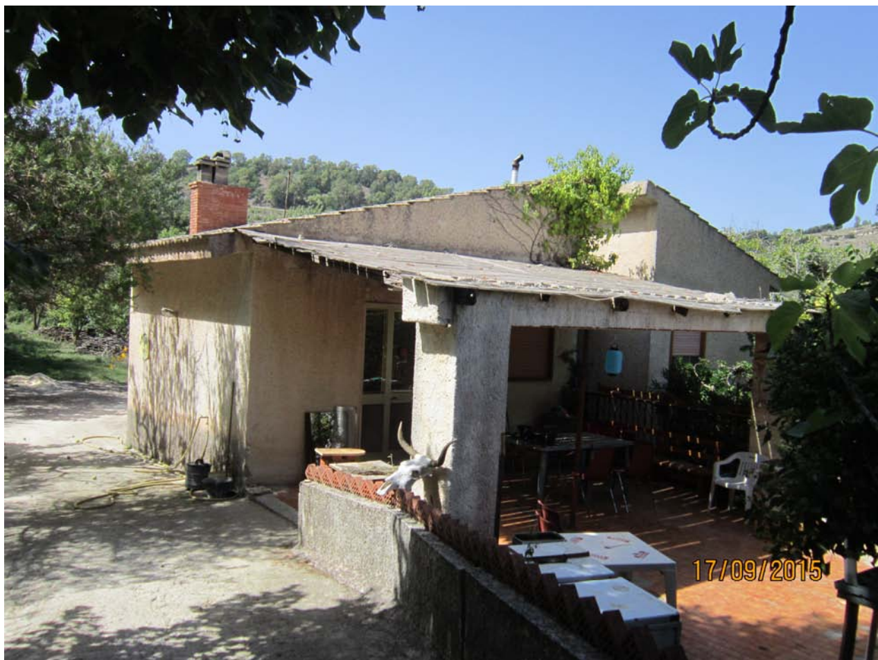
Foto n° 14 – Edificio in c.da Goso a Buccheri – Prospetto esterno e veranda