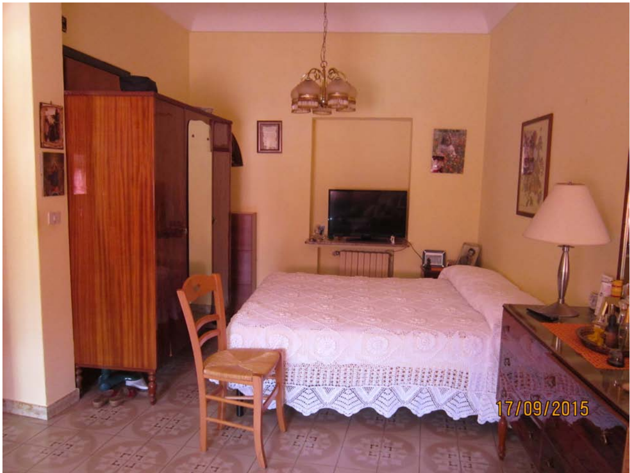
Foto n° 10 – Appartamento a Bucerchi – Soggiorno-letto a 1° piano