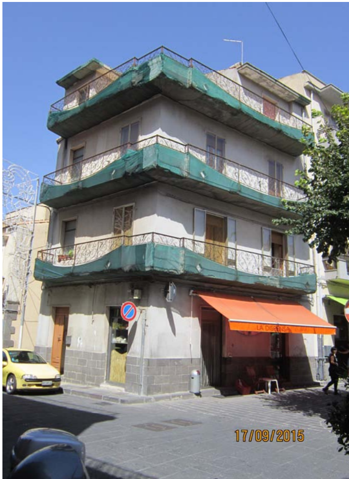
Foto n° 1 – Edificio a Bucchini - Prospetto Piazza Roma angolo Via Umberto I