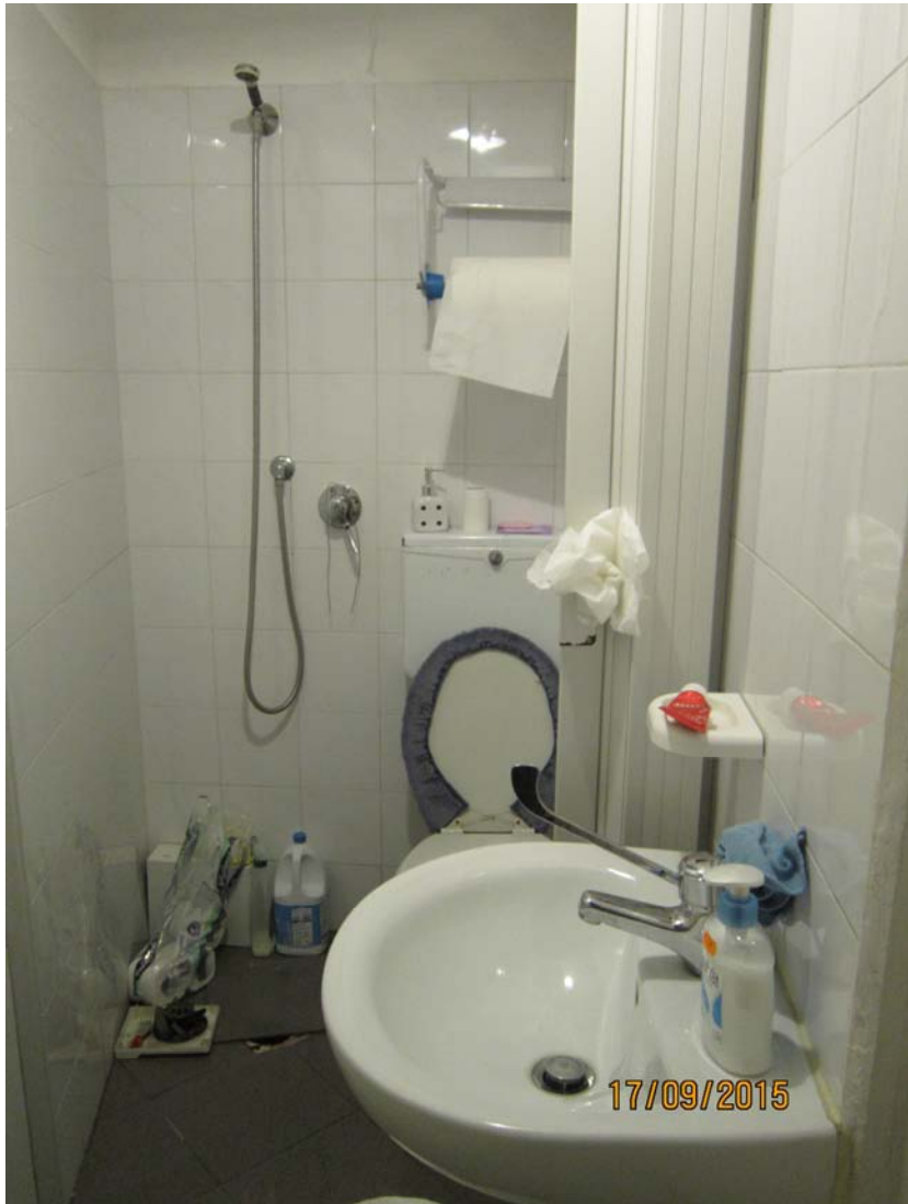
Foto n° 5 – P.T. edificio a Bucchini – Servizi igienici attività commerciale